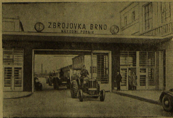
ЧЕХОСЛОВАКИЯ. На заводе «Зброевка» в Брно. Тракторы марки «ЗЕТ» выходят из заводских ворот.